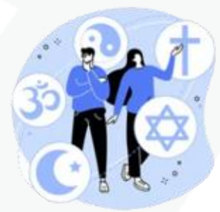
sua preferência religiosa

Agora fica fácil você compreender que o uso mal intencionado desses dados pode criar muitos problemas, como ocorre com os conhecidos golpes de boletos bancários, fraudes em contas de aplicativos, abertura indevida de contas bancárias e de consumo.