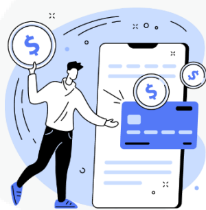
seus hábitos de consumo