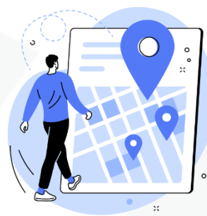
seus hábitos de deslocamento