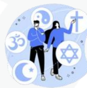
sua preferência religiosa

Agora fica fácil você compreender que o uso mal intencionado desses dados pode criar muitos problemas, como ocorre com os conhecidos golpes de boletos bancários, fraudes em contas de aplicativos, abertura indevida de contas bancárias e de consumo.